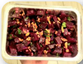
Salade de betteraves aux noix