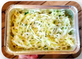
Salade de chou-blanc

Olives vertes, tomates, citrons confits, ail, oignons, zaatar, harissa léger.