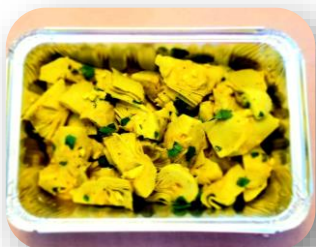
Salade de cœurs d'artichauts

Betteraves, noix de Grenoble, huile, vinaigre de cidre, échalotes, persil.