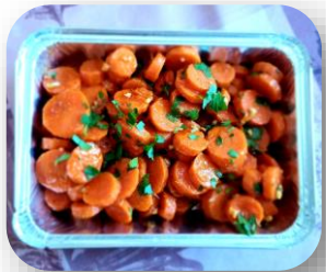
Carottes cuites au cumin