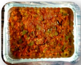
Salade cuite Tchouktchouka